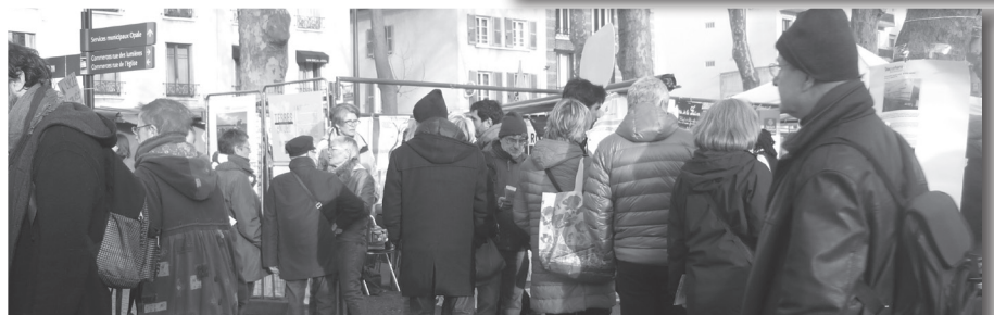
Aldea Global de alternativas (FIMARC Expo calada en la COP21