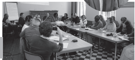
Los participantes en el seminario sobre la Agricultura Familiar